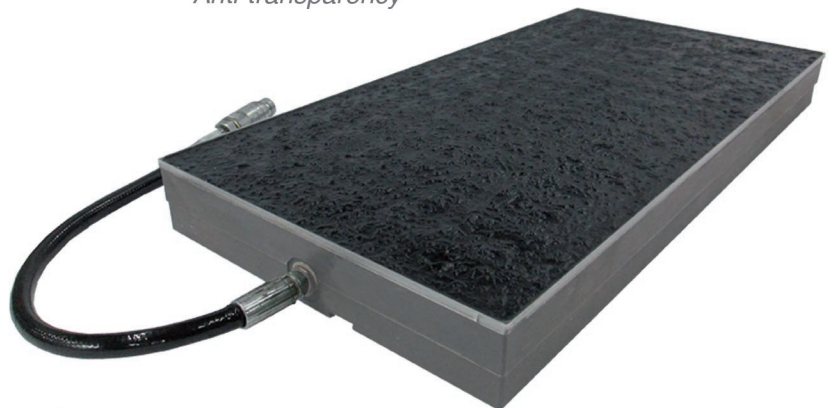
PUNZONE ISOSTATICO 30x60 muratura antitrasparenza ISO P-PUNCH 30x60 mortar groove for antitransparency

Highlights of GAPE DUE isostatic punches: High compensation and single caliber Reduced deformation and utmost flatness Reliability and long life Versatility and flexibility Anti-transparency