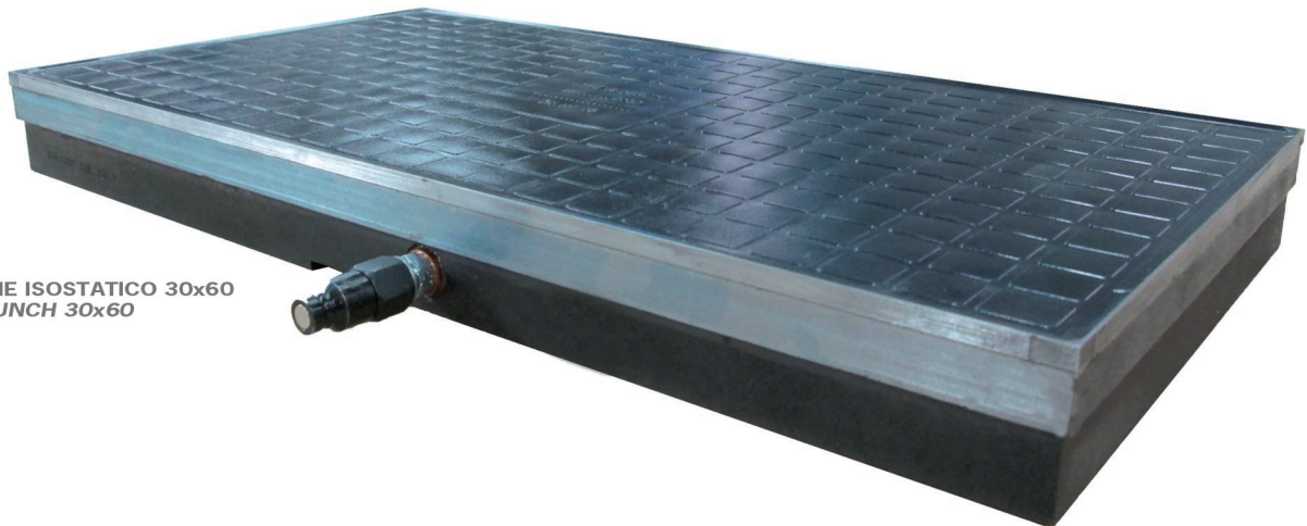
PUNZONE ISOSTATICO 30x60 ISO P-PUNCH 30x60

Punti di forza dei punzoni isostatici GAPE DUE: elevata compensazione e monocalibro deformazione contenuta e massima planarità affidabilità e durata versatilità e flessibilità Antitrasparenza